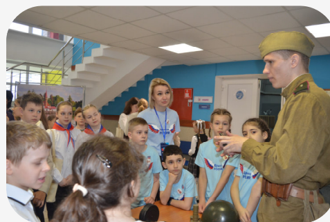
«ВОВ. Я помню, я горжусь!»

МБОУ ДО «Гатчинский Дворец детского (юношеского) творчества», ГБУ ДО «Центр «Ладога»