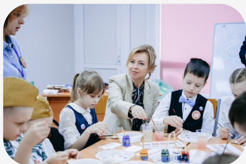
«Роспись по дереву «Волховский розан»

МБОУ ДО «Гатчинский Дворец детского (юношеского) творчества», ГБУ ДО «Центр «Ладога»