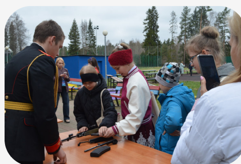
«Фланкировка, сборка и разборка оружия»

Реконструкторский клуб «XIII век», ЛГУ имени А. С. Пушкина